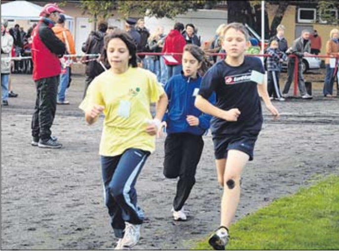
Der Schnupperlauf wird erneut wieder viele Kids in das Zerbster Jahnstadion locken.